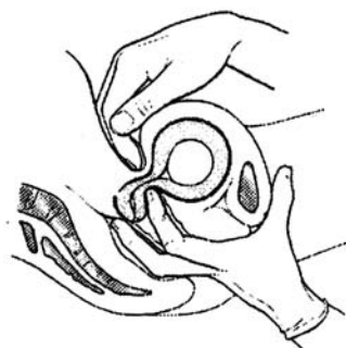
Abbildung 2 : HEGARsches Schwangerschaftszeichen (Pschyrembel 1997)

Die Zervix uteri besteht zum grössten Teil aus Bindegewebe, welches ein sehr komplexes Netzwerk aus Typ-I-und-III-Kollagen, Fibronectin, Elastin, Fibroblasten, Proteoglykanen und einem Wasseranteil bis zu 80% darstellt; nur 8-10% glatte Muskulatur sind enthalten. Diese Zusammensetzung verändert sich im Laufe der Schwangerschaft (Uldbjerg 1983). Bereits im ersten Trimenon kommt es durch die Aktivierung von Proteasen und einer vermehrten Wassereinlagerung zu einer kontinuierlichen Reorganisation von Kollagenfibrillen. Durch diese Veränderung fühlt sich die Zervix palpatorisch bereits weicher an und es resultiert eine besonders leichte Zusammendrückbarkeit des unteren Uterinsegments. Dieses Phänomen wird als das sogenannte „Hegarzeichen“ beschrieben (siehe folgende Abbildung). Im weiteren Verlauf kommt es durch die immer zunehmende Wassereinlagerung zu einer relativen Verminderung der zervikalen Kollagenkonzentration.